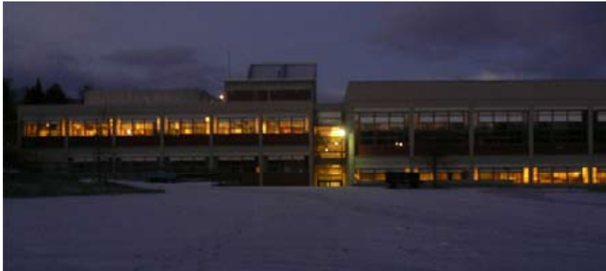
Huseby er en aktiv skole, selv i høstmørket.