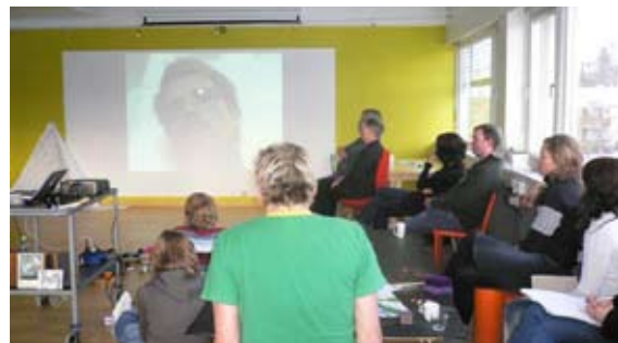
Videooverføring fra Stavanger gir spådommer om fremtiden

Om femten år vil det være slutt på livsfasene slik vi kjenner dem i dag. Vi begynner allerede nå å innse hvor bortkastet det er å la de over 67 år og ungdommene under 25 utebli fra verdiskapingen i Norge. I fremtiden vil alle utdanne seg litt hele tiden. Dette vil være helt nødvendig for å