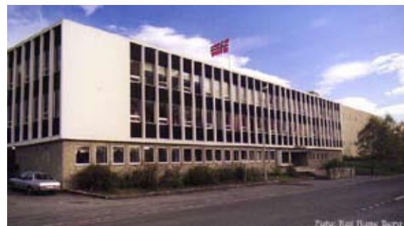
Rosenborg skole har tatt tiden til hjelp i undervisningen

modning. Paradoksalt nok kan vi si at elevene har mindre press fra lærerne, men oppnår allikevel større forståelse for hele pensum. Vi kaller det inkubasjonstid. Rektor ved Rosenborg skole er meget engasjert når hun