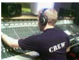
Ugla har investert i topp utstyr

Det siste året har Ugla skole bygget musikkverksted, digitalt verksted, en stor formgivingslab og et kreativt rom. Det kreative rommet brukes til idéutvikling og andre kreative prosesser.